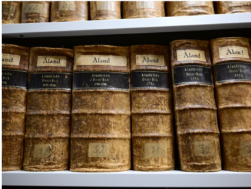
I Ålands landskapsarkiv finns det böcker bevarade från flera hundra år tillbaka.