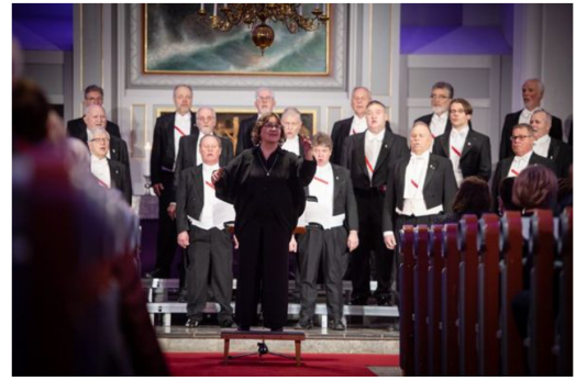
Mariehamns Kvartetten under sin julkonsert i Jomala kyrka 2021.