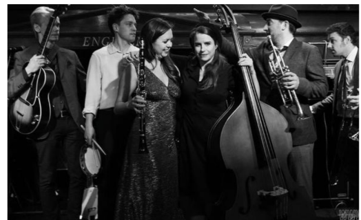
Patchwork Jazz Band.