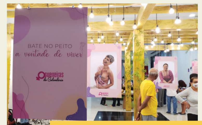
1. Cartilha digital criada para auxiliar os participantes com as plataformas de reuniões virtuais para que pudessem participar das reuniões e workshops. 2. Exposição “Guerreiras do Calendário”