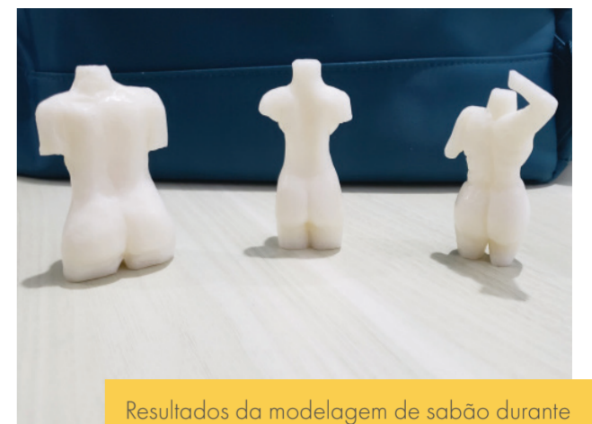
Resultados da modelagem de sabão durante o treinamento da equipe para a oficina de modelagem.

Este estudo analisa qualitativamente o bem-estar individual e social de mulheres sobreviventes de câncer de mama mastectomizadas em Pernambuco, Brasil. Este estudo foca no potencial do design como veículo de ressignificação da autoimagem de mulheres mastectomizadas por câncer de mama, além de auxiliar na redução de percepções negativas sobre seu corpo. Por meio de entrevistas, oficinas e exposições em colaboração com o Grupo de Apoio e Autoconhecimento para Pessoas com Câncer, este estudo coletou diversas experiências pessoais de sobreviventes de câncer de mama e de pessoas em tratamento, destacou as demandas durante as diferentes fases do tratamento de câncer, trouxe insights sobre a relação que essas mulheres estabelecem com o próprio corpo e com os artefatos que utilizam, e permitiu que as mulheres explorassem estratégias para reconstruir sua autoimagem e quebrar tabus relacionados à mama e ao câncer de mama.