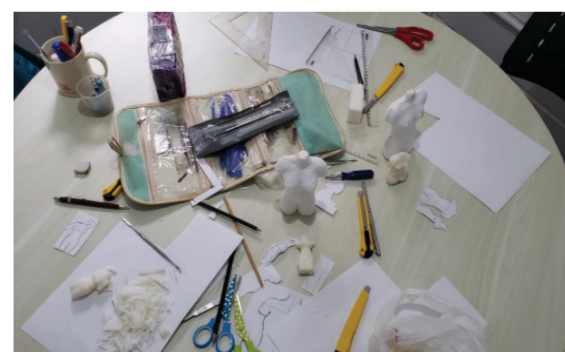
1. Pesquisa exploratória virtual feita antes das oficinas. 2. Oficina de treinamento de modelagem para a equipe usando sabão para criação dos modelos.