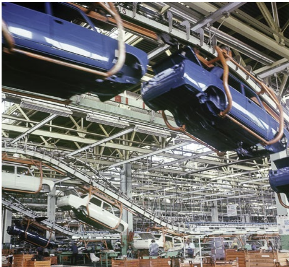
В конце 1960-х технологическое отставание СССР было налицо, поэтому знаменитые советские «жигули» приходилось выпускать по итальянским лекалам