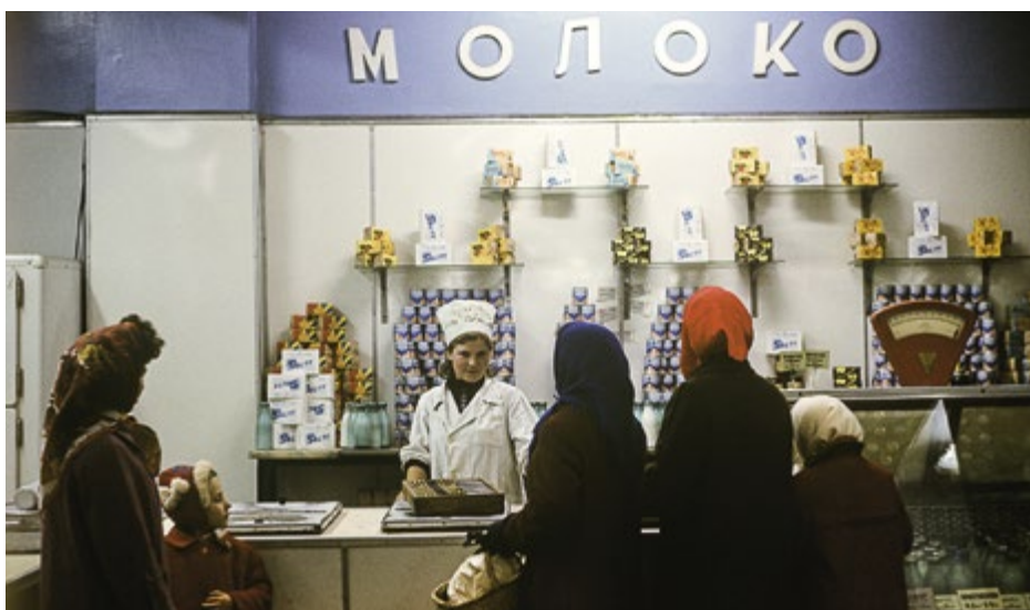
В относительно благополучные 1970-е очереди в магазинах были не так велики